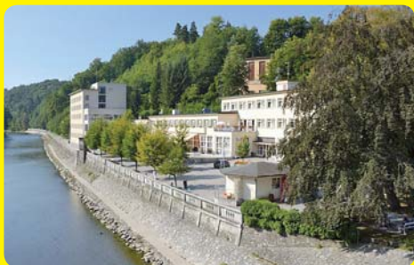
Lázně Teplice nad Bečvou

Podrobnější informace získáte při přihlašování.