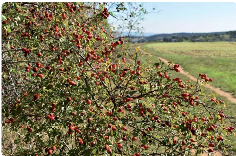
U Vaneckého koutu

V současné době se připravuje několik nových výběrových řízení. Znovu vypisujeme výběrové řízení na výstav-